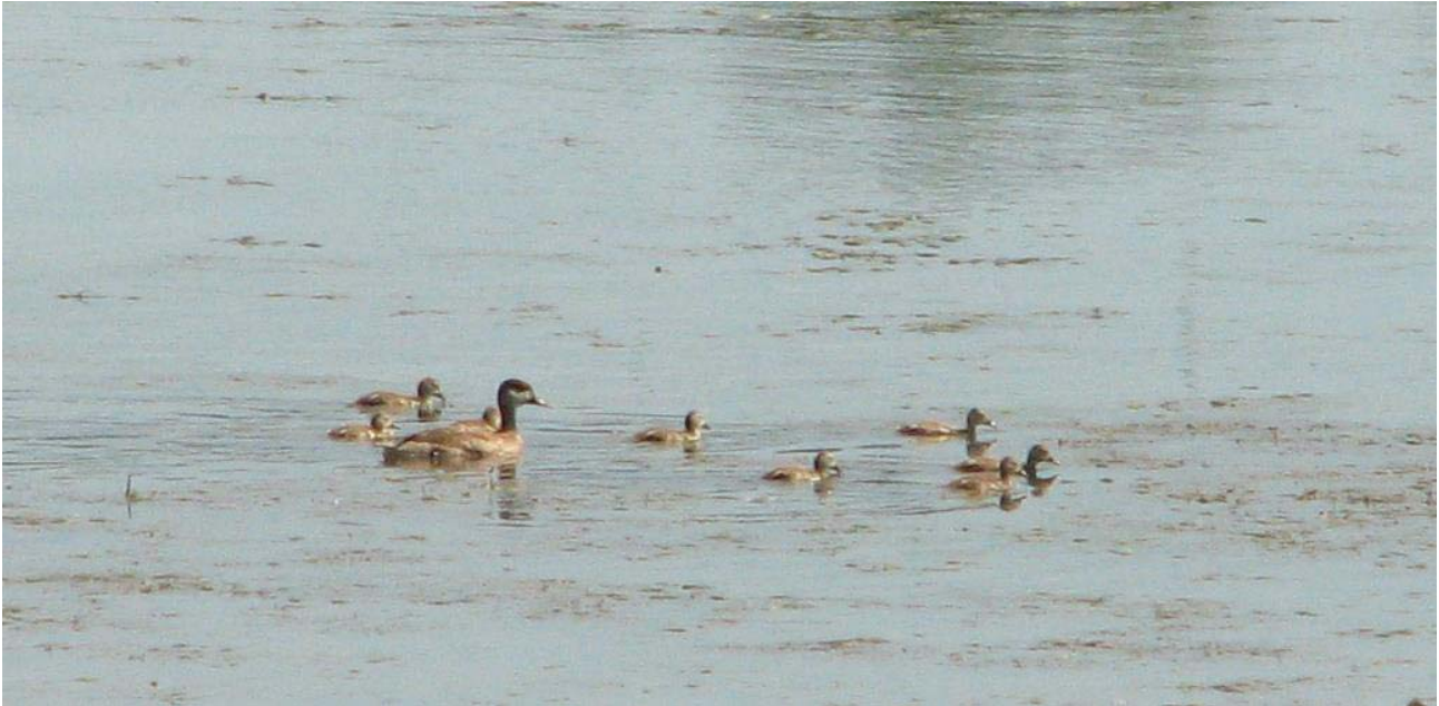
Fig. 6 - Femmina di Fistione turco con pulcini (foto Roberta Valle/ Associazione Naturalistica Codibugnolo).