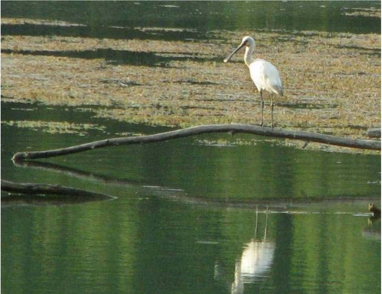
Fig. 7 – Spatola nella zona umida di San Siro.