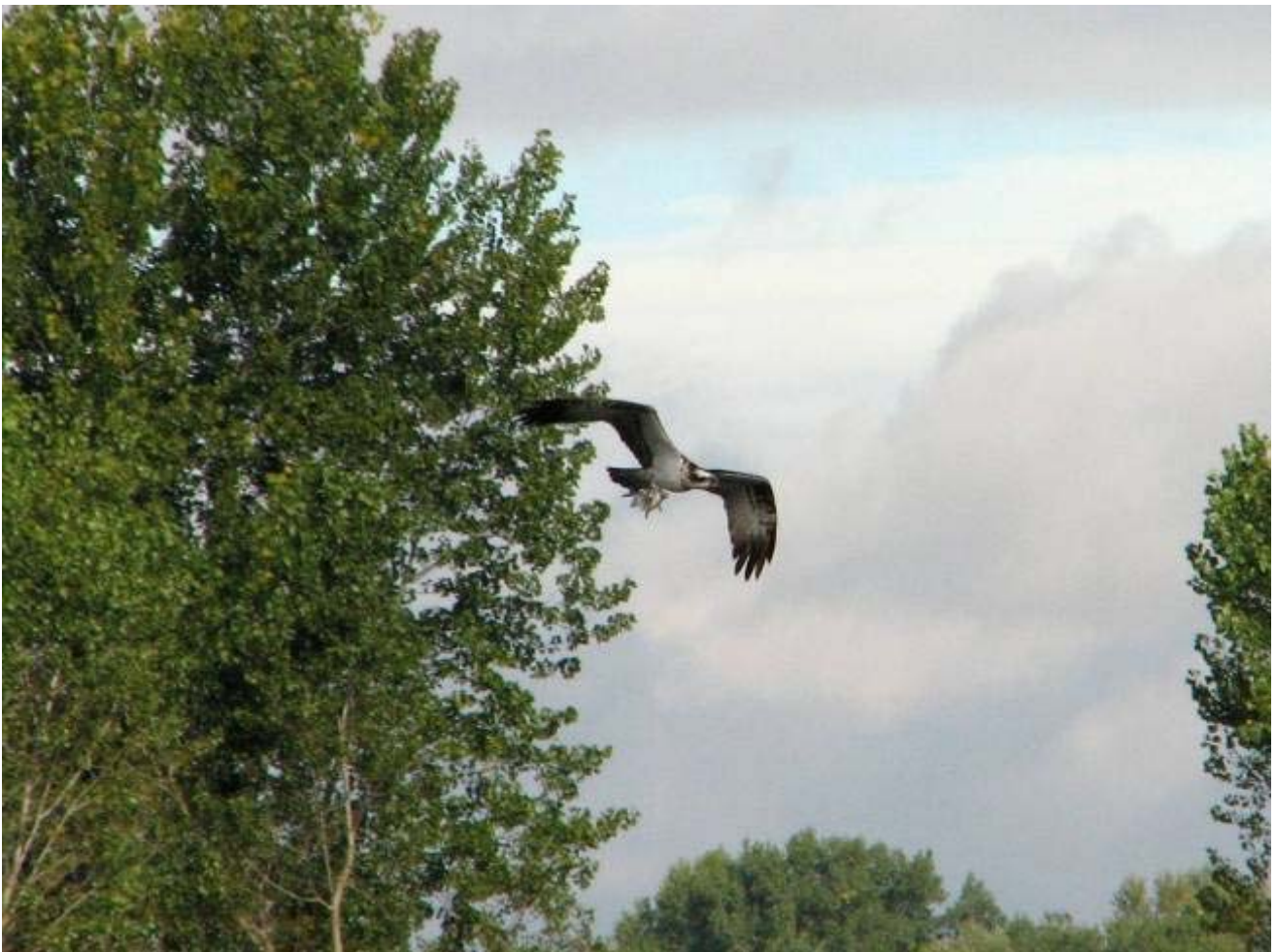
Fig. 10 – Falco pescatore che trasporta una preda (foto Roberta Valle/ Associazione Naturalistica Codibugnolo).

L'Oasi viene frequentata con regolarità da individui in migrazione, verosimilmente in quanto collocata lungo l'importante linea migratoria rappresentata dal fiume Po; ad esempio: 1 immaturo il 31/08/2010 (M. Gagliardone e N. Scatassi in Aves), 1 ind. l'1/10/2010 (U. Binari e E. Bezzoni in Ornitho.it), 1 ind. il 2/11/2012 (C. dell'Acqua in Ornitho.it), 1 ind. il 21/04/2014, 1 ind. il 07/05/2014, 1 ind. il 14/06/2014, 1 ind. il 12/09/2014, 4 ind. il 29/03/2015, 1 ind. l'08/05/2015, 1 ind. il 25/09/2015 e i successivi 26/09 e 03/10 (DM, RV).