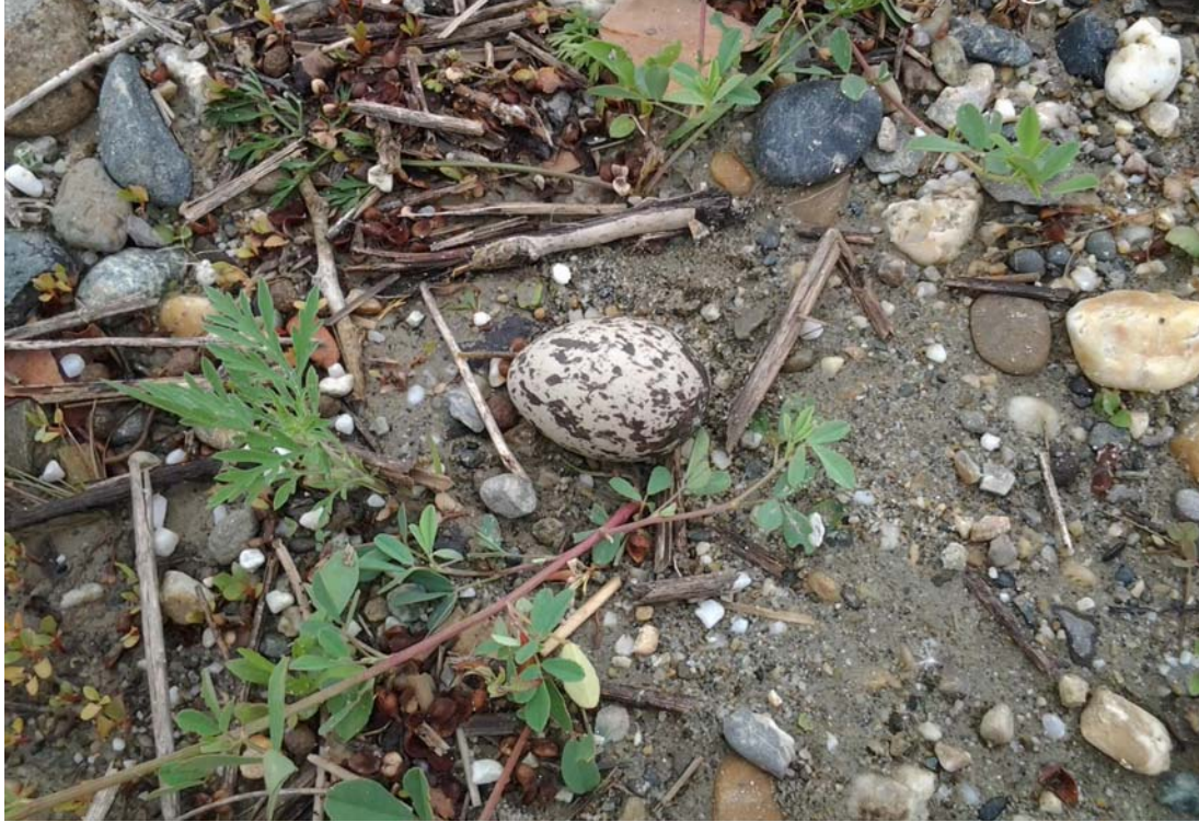
Fig. 11 – Nido di Occhione rilevato nel 2014.