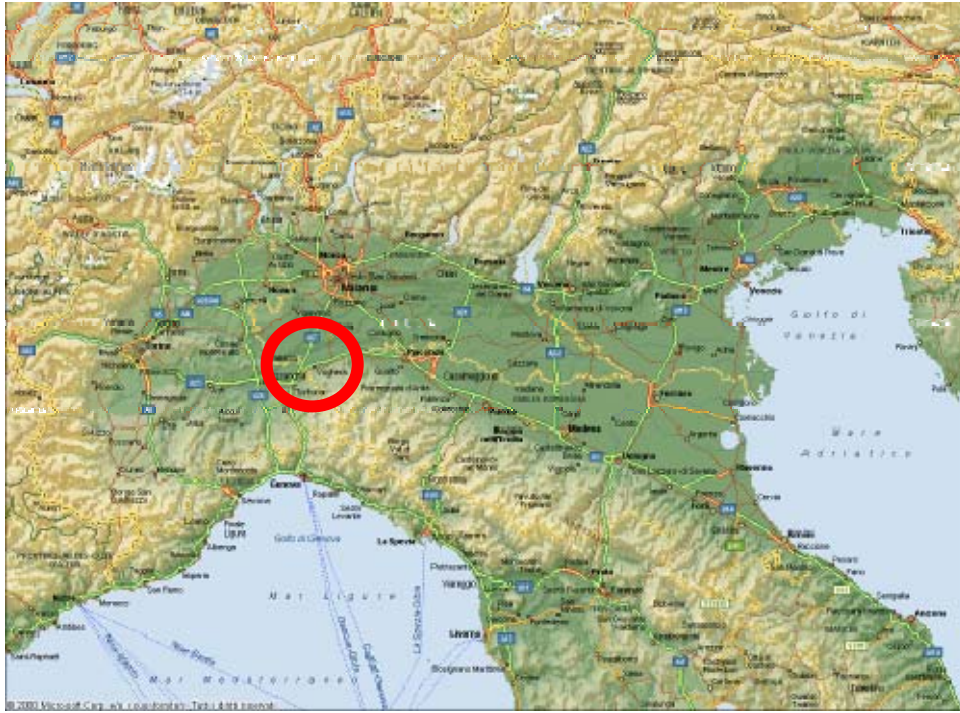
Fig. 1 - Localizzazione a scala nazionale dell'Oasi Naturalistica di Isola Sant'Antonio.