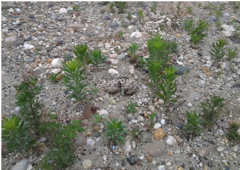
Fig. 12 – Nido di Occhione rilevato nel 2015.