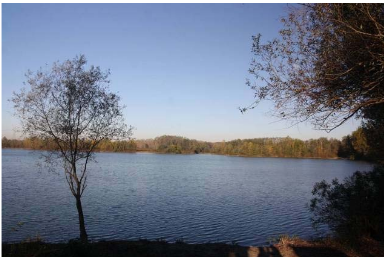
Fig. 5 - Il lago di Brusa Vecchia.