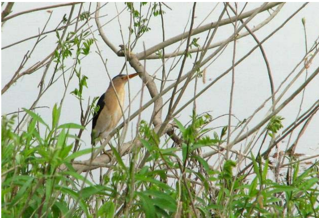
Fig. 8 – Maschio di Tarabusino