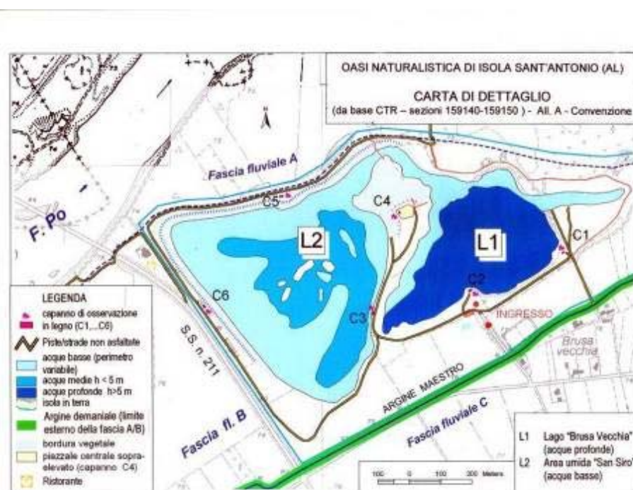
Fig. 3 - Cartina di localizzazione dei due piccoli bacini lacustri artificiali con indicati i capanni realizzati.

L'area nel suo complesso evidenzia buone potenzialità (alcune già in atto) sia di carattere naturalistico-scientifico, che turistico-ricreativo locale, educativo e culturale; è un luogo utilizzabile come "laboratorio a cielo aperto permanente" dalla popolazione scolastica ed extra scolastica, locale e non. Nell'area sono stati realizzati 6 capanni per l'osservazione naturalistica.