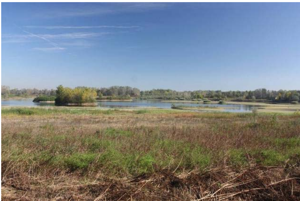
Fig. 4 - La zona umida di San Siro.